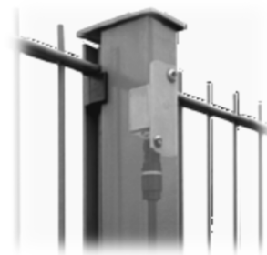
peristop® - IMS 3D-Beschleunigungssensoren