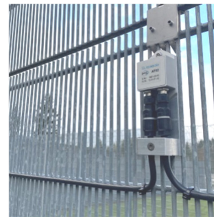
peristop® - IMS 3D-Beschleunigungssensoren