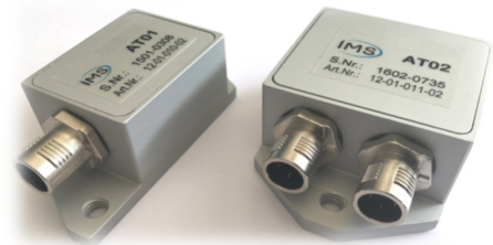
peristop® - IMS 3D-Beschleunigungssensoren

Für eine vollständige Integration von Toren, Türen oder weiteren Detektionssystemen (z.B. Lichtschranken, etc.) in den Überwachungskreis, dient das MIO- 2/0 Multi-I/O-Modul. Das Modul ist zur direkten Überwachung potentialfreier Kontakte (z.B. Falz- und Riegelkontakte) entwickelt und benötigt keine zusätzliche externe Spannungsversorgung, so dass es an jeder Stelle des CAN-Bus implementiert werden kann.